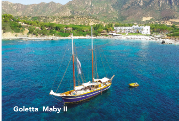
Goletta Maby II