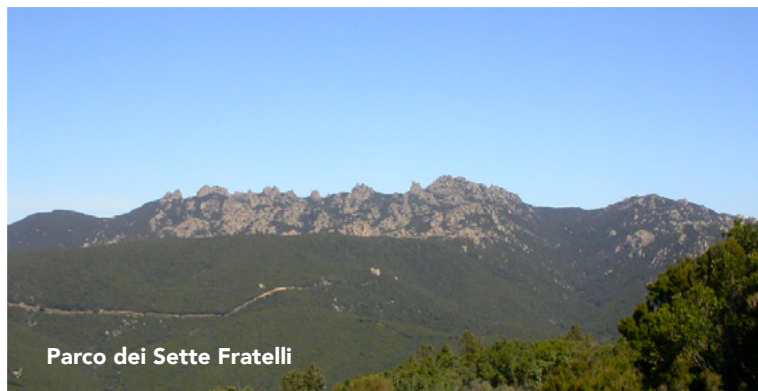
Parco dei Sette Fratelli